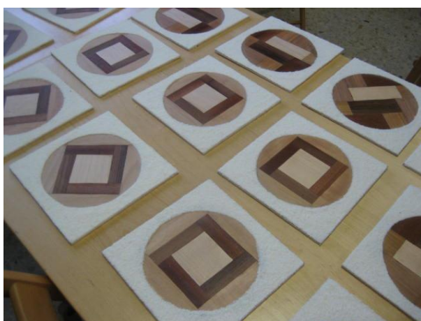
i disegni finiti